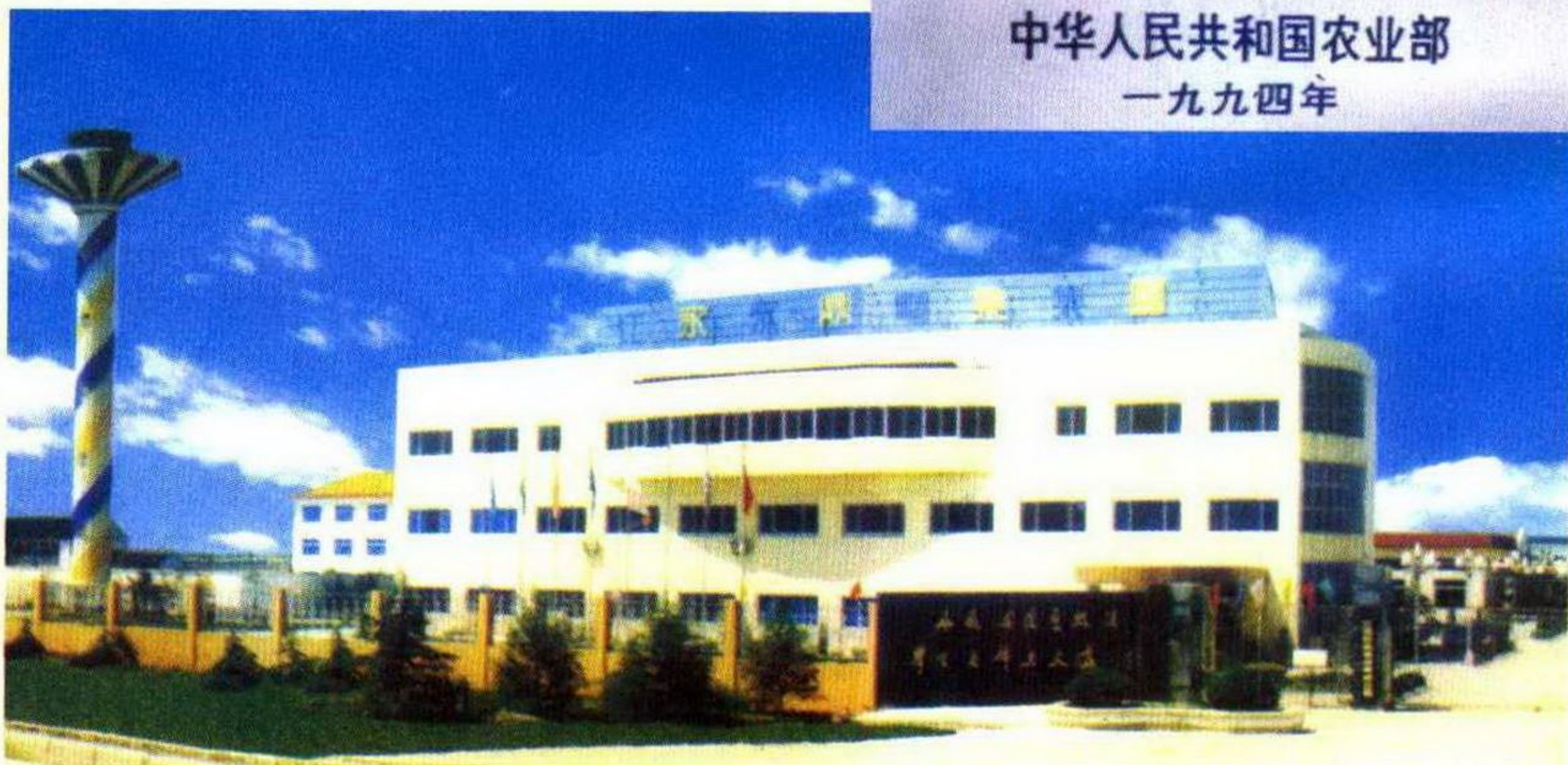
永鼎集团获全国最佳经济效益乡镇企业荣誉称号。