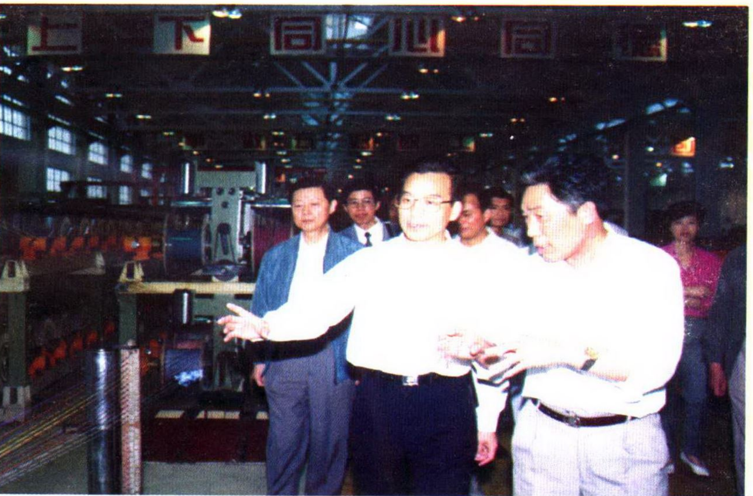
中共中央政治局候补委员、中央书记处书记温家宝考