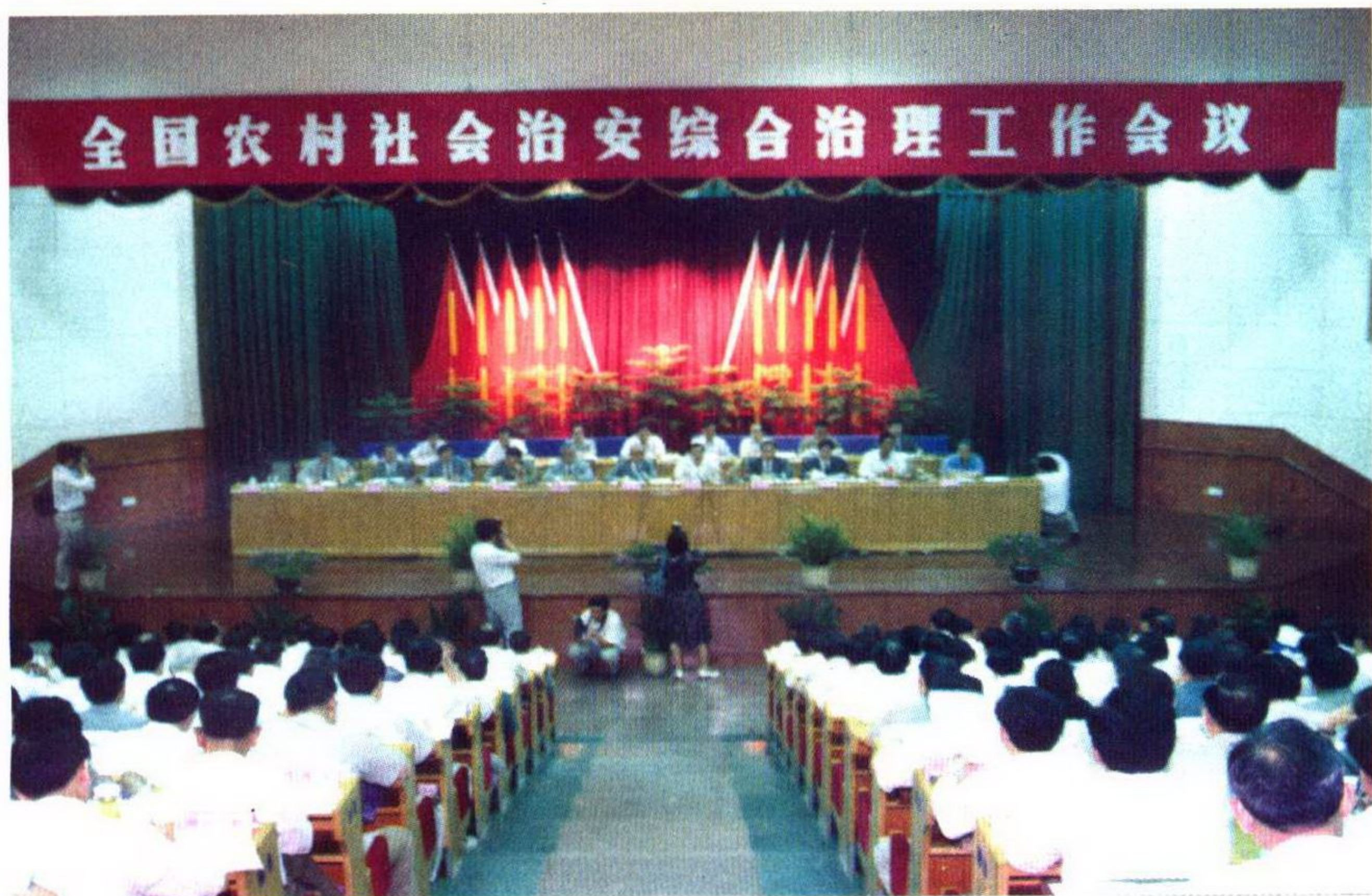
全国农村社会治安综合治理工作会议在吴江召开。