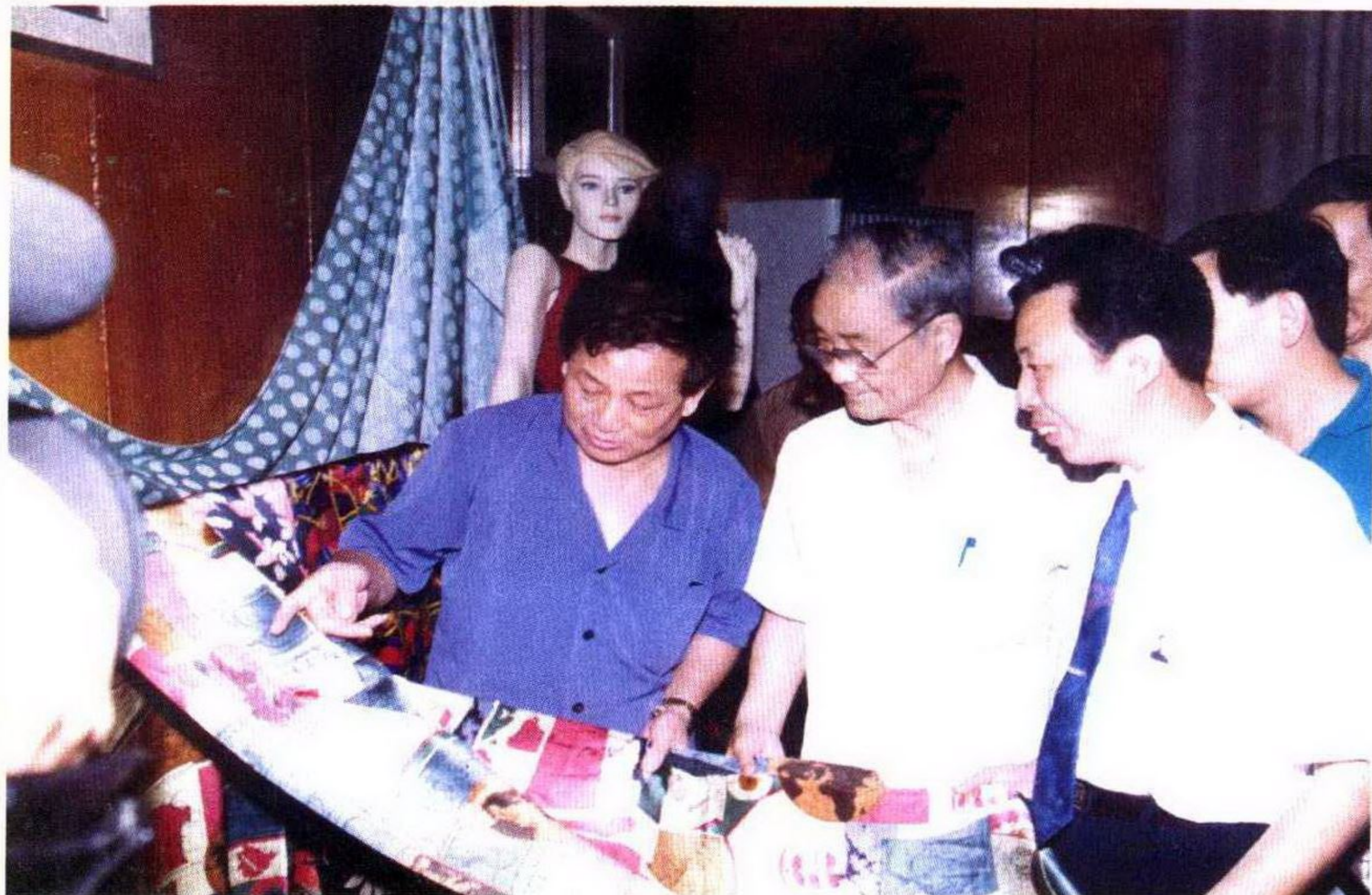
原中共中央政治局常委宋平视察吴江新民厂。