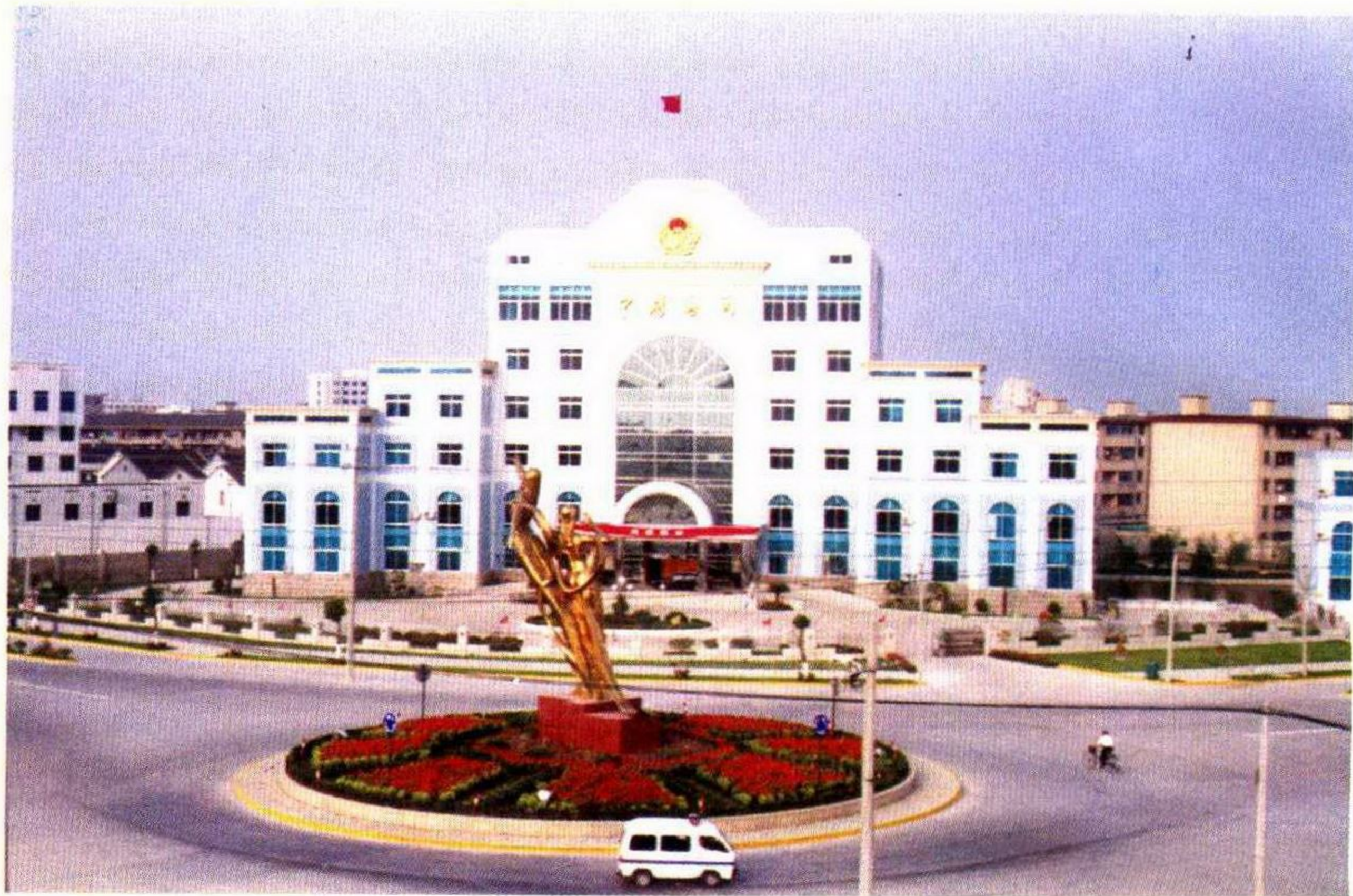
苏州海关驻吴江办事处办公大楼。