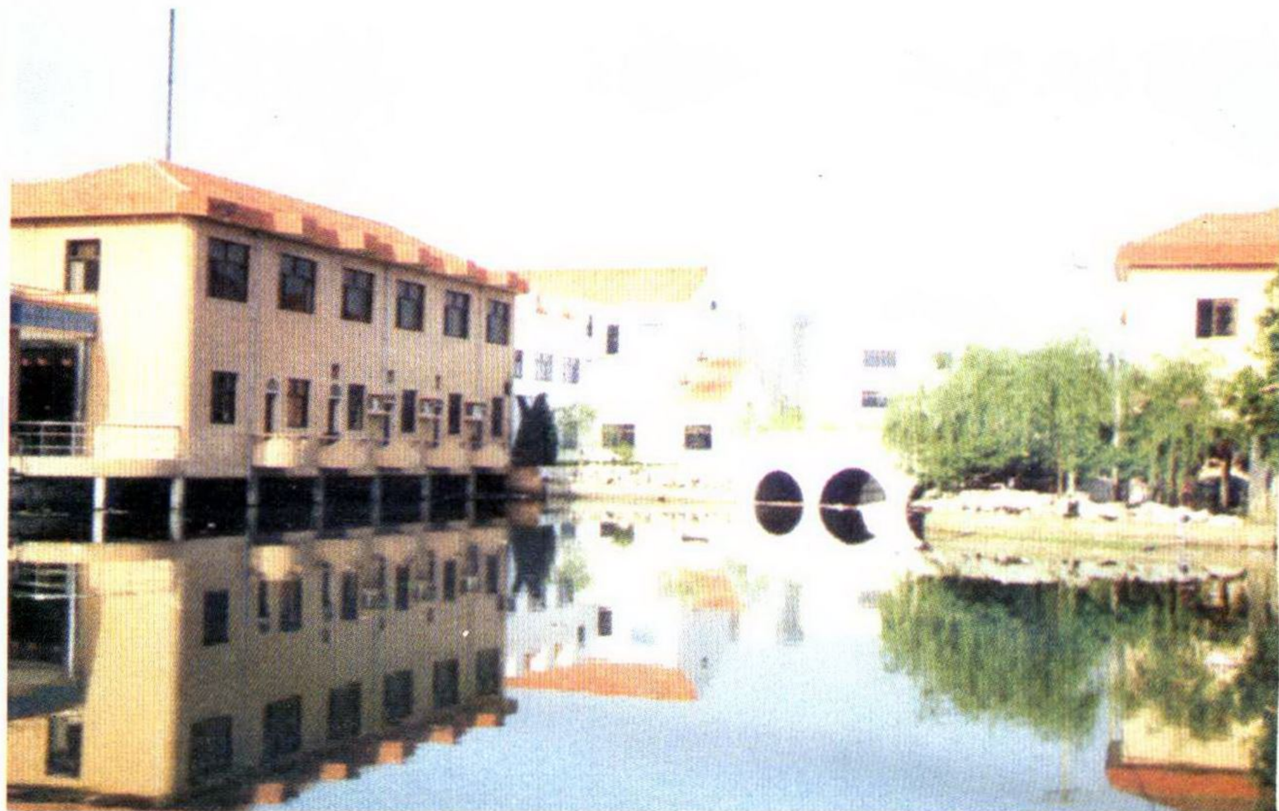
桃源镇小城镇建设。