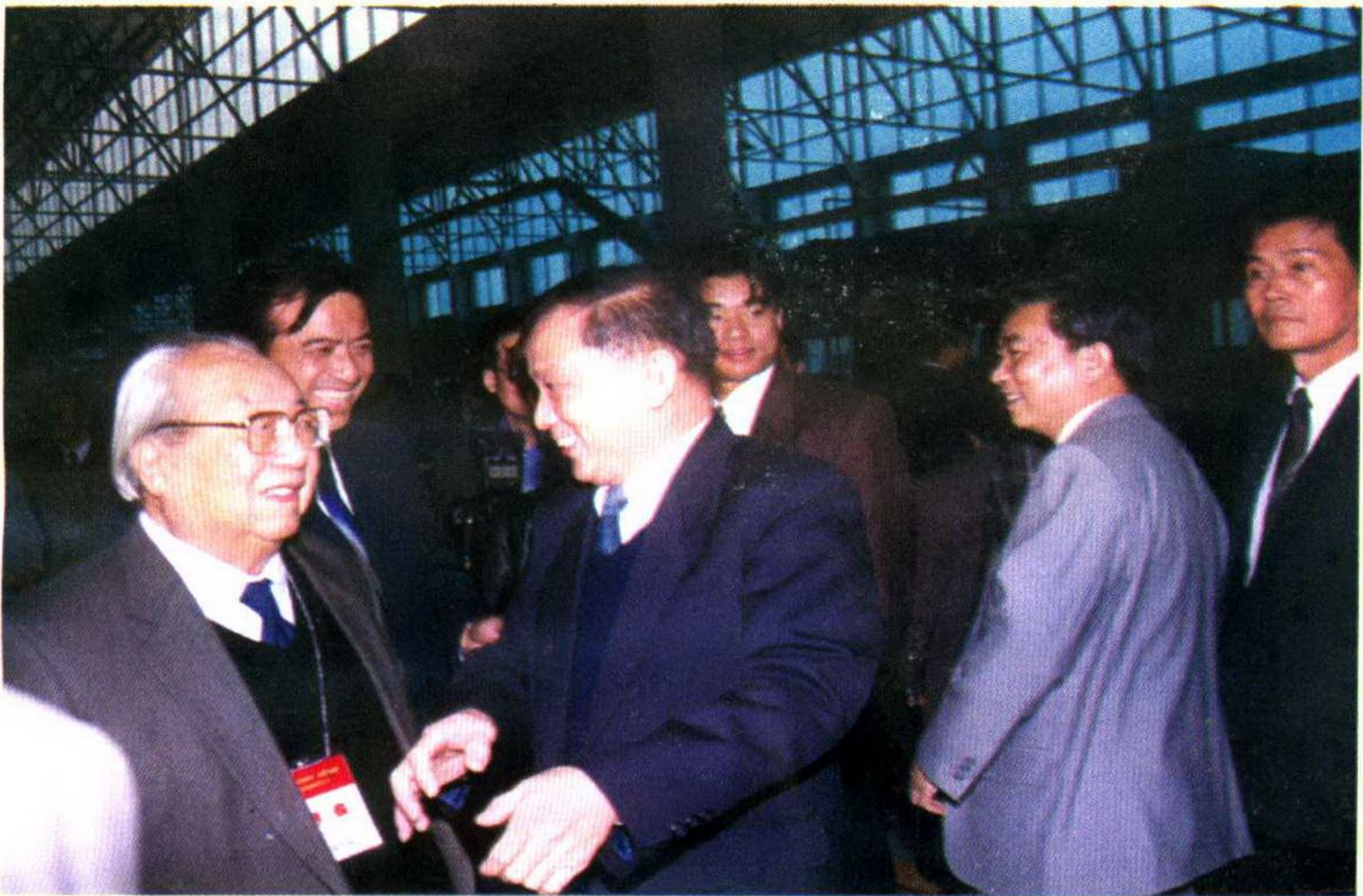
全国人大常委会副委员长费孝通视察吴江。