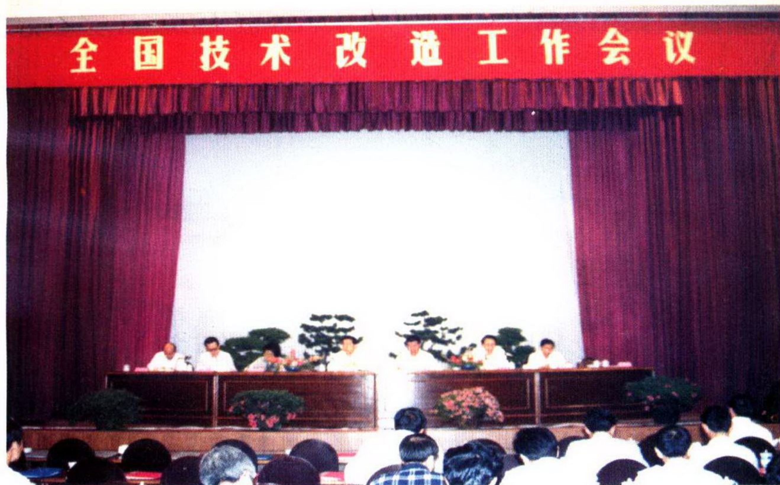
全国技术改造工作会议在吴江召开。