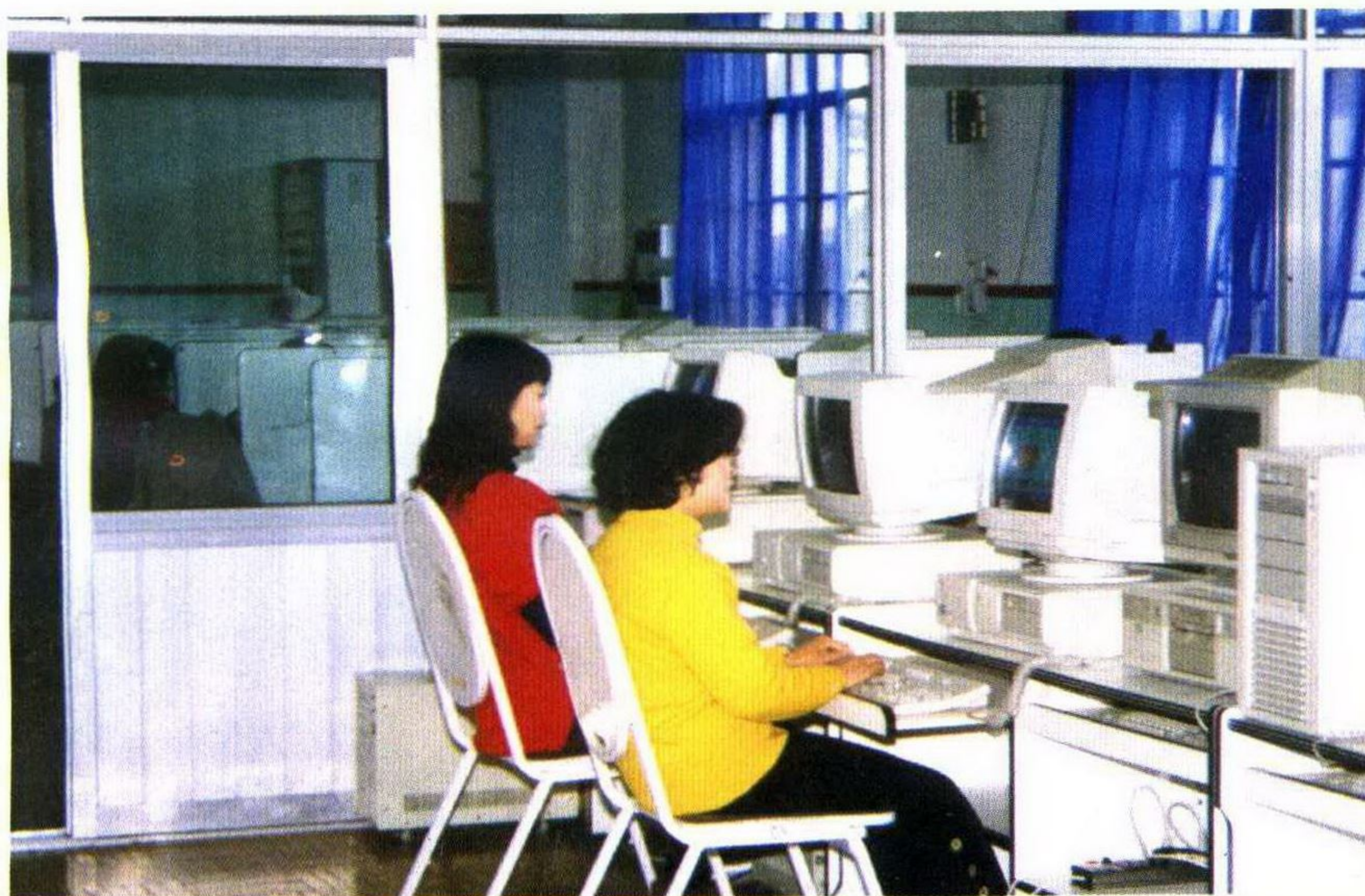
吴江市邮电局 CNOC 中心。