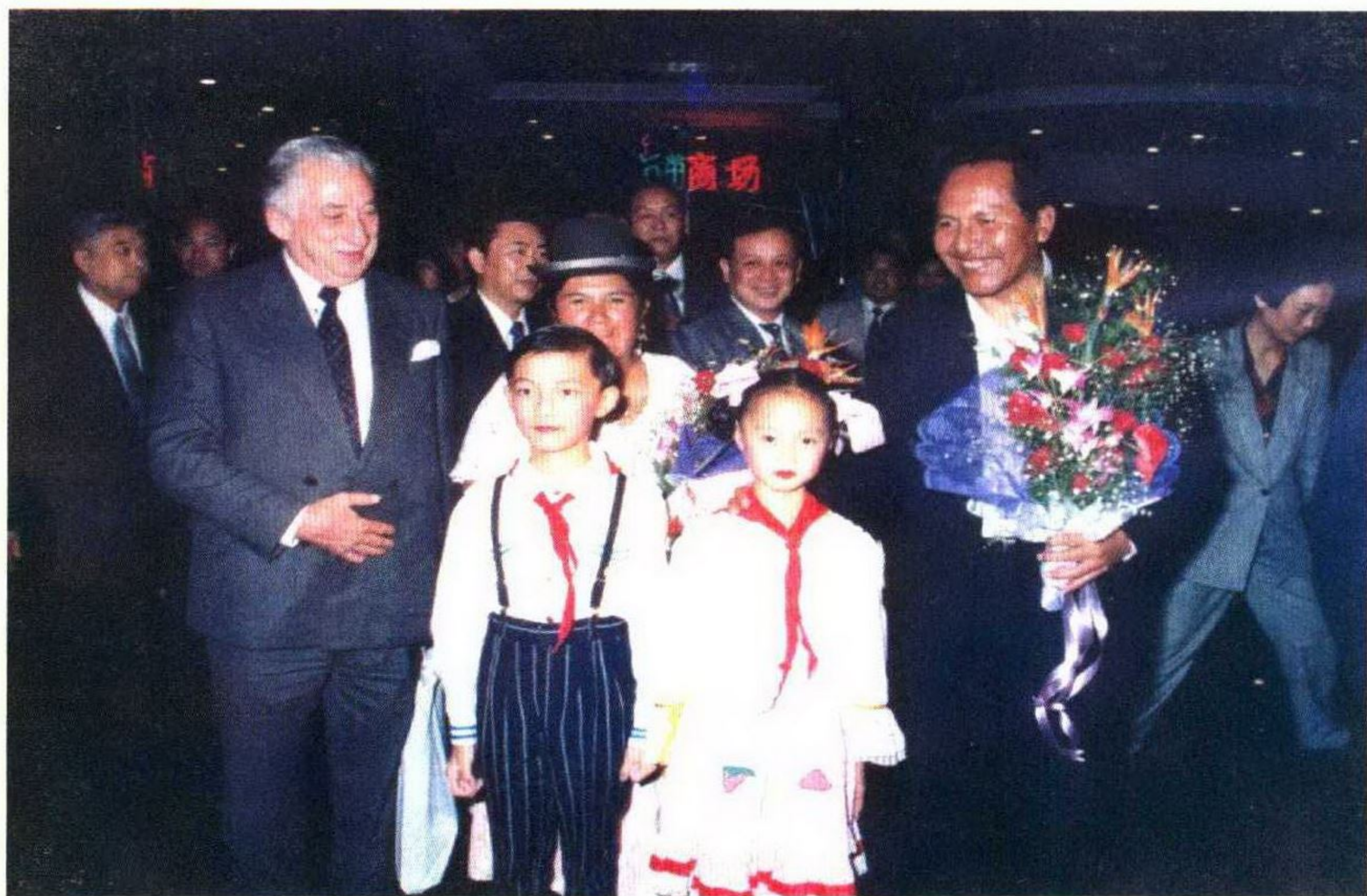
玻利维亚副总统维克多·乌戈·卡德纳斯和夫人访问