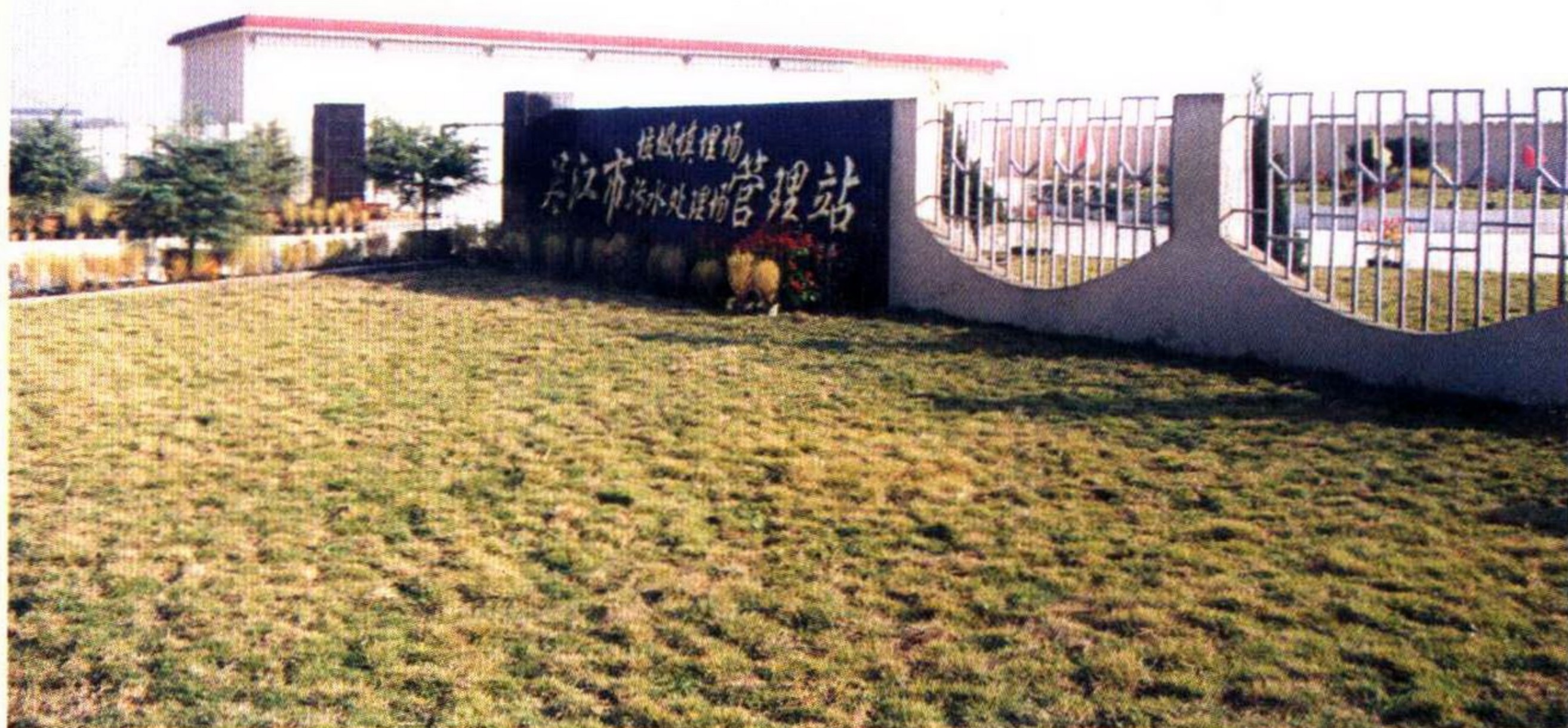
吴江市垃圾污水管理站。